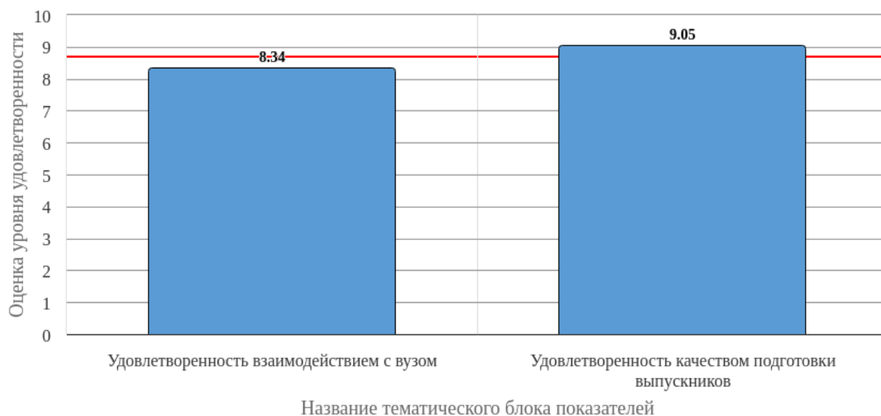
Рисунок 2.1 - Средняя оценка удовлетворенности (по тематическим блокам показателей)

Средняя оценка удовлетворенности респондентов по блоку вопросов «Удовлетворенность взаимодействием с вузом» равна 8.34, что является показателем высокого уровня удовлетворенности (75-100%).